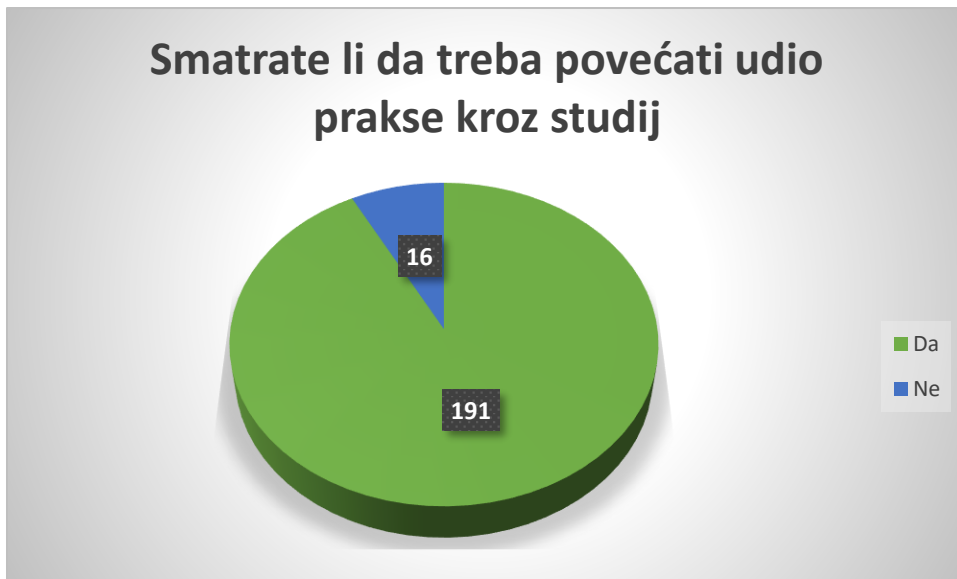
Grafikon 3. Ocjena poslodavaca o potrebi povećanja udjela stručne prakse tijekom studija